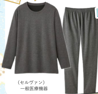
(セルヴァン) 一般医療機器